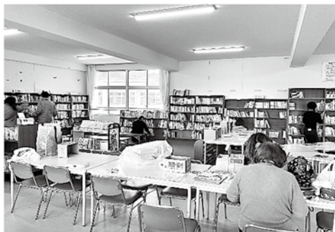
図書ボランティア（小学校）

天理市櫛本小学校「こども夢応援プロジェクト」代表にお越しいただき、活動についてお話を聞きました。地域の特質を生かした子どもたちのための熱心な活動に、よい刺激をいただきました。