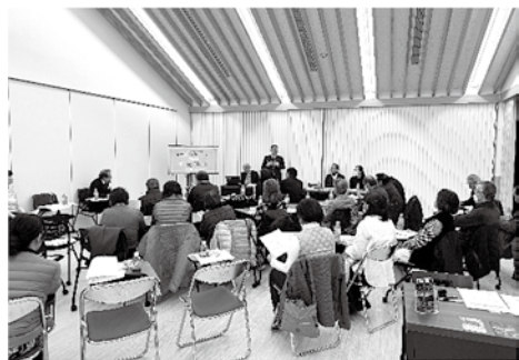
協力者の集い（役場交流ホール）