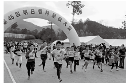
▲ジュニアの部スタート!